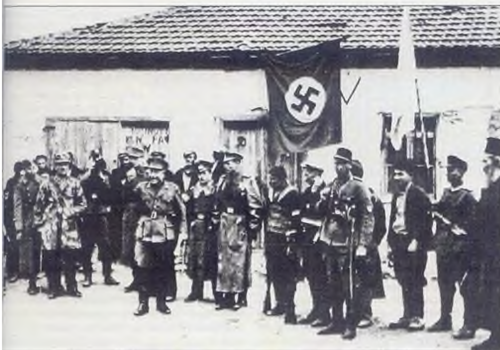
Ο Πούλος μιλά σε κάποιο χωριό στη βόρεια Ελλάδα εναντίον των "κομμουνιστών" και των "κεφαλαιοκρατών". Προσέξτε πίσω του τη γερμανική σημαία με τον αγκυλωτό σταυρό.

Αυτές οι ολότελα διαφορετικές απόψεις παρατηρούντο μέχρι τότε στα ελληνικά πανεπιστήμια, στα καφενεία και στις ταβέρνες των μεγάλων πόλεων. Σταδιακά έφθασαν στα βουνά, στα χωριά και γενικότερα στην ελληνική ύπαιθρο.