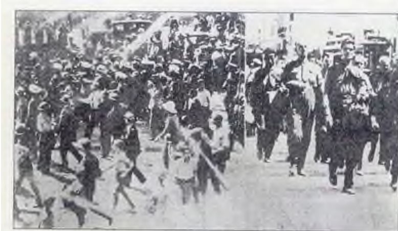
Στιγμιότυπο από την κάθοδο της ΕΕΕ στην Αθήνα.