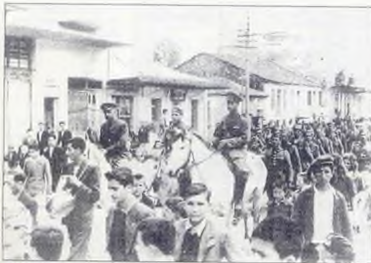
"Πουλικοί" στους δρόμους της Κράσας Βρύσης. Η φωτογραφία αυτή βρίσκεται στο Μουσείο Σύγχρονης Ιστορίας της Λουμπλιάνα (Σλοβενία).