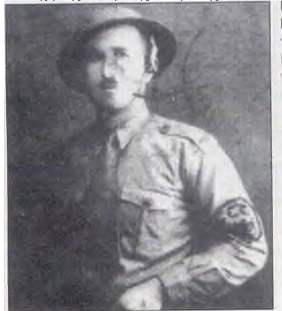
Χαλυθδόκρανος της ΕΕΕ (από το "Εν Θεσσαλονίκη", εκδόσεις Εξάντας).

Χαρακτηριστικό δείγμα για την κατάσταση που επικρατούσε τότε στους δρόμους και τις γειτονιές πολλών επαρχιακών πόλεων είναι η επιστολή που έστειλε ένας "Τριεπιλίτης" από την Ξάνθη στην εφημερίδα "Δράση" του κινήματος: "Στας 9 όλοι οι Αλκιμοί της ΕΕΕ συγκεντρωμένοι περίμεναν τας διαταγάς του ομαδάρχου. Αυτός, αφού μας ομίλησε δια την ημέραν των εκλογών, edιάλεξε περί τους 25, τους καλύτερους και μεγαλύτερους εξ ημών, τους διέταξε να πάνε να φάνε στα σπίτια τους και στις 10 ακριβώς το βράδυ να βρίσκονται στη Λέσχη. Οι άλλοι ήσαν ελεύθεροι... Στις 10 ακριβώς η βροντώδης φωνή του αρχηγού ακούεται... Να σταμπάρετε τα σφυροδρέπανα (σ.σ. που ήταν ζωγραφισμένα στους τοίχους της πόλης) και να τα μετατρέψετε σε δικέφαλους αετούς. Αμέσως χωρισθήκαμε σε τρία τμήματα. Το πρώτο με επικεφαλής τον ίδιον έκαμε την αρχήν και μετέβαλε το κόκκινο σφυροδρέπανο σε έναν όμορφο αετό. Κατά τις 2 π.μ. τα δύο τμήματα συνεπλάκησαν με τμήμα κομμουνιστών (περί τους δέκα) οι οποίοι εκολλούσαν ρεκλάμες (αφίσες) με την κόκκινη σημαία. Τα ποντίκια -αφού τους εξυλοκόπησαν- τους έκαμαν να τραπούν εις άτακτοι φυγή αφήσαντας ως λάφυρα, τις ρεκλάμες των, μία σκάλαν, ένα πινέλο, κόλλα κ.ά.