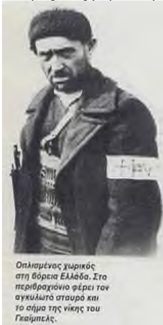
Οπλισμένος χωρικός στη βόρεια Ελλάδα. Στο περιβραχιόνιο φέρει τον σγκυλωτό σταυρό και το σήμα της νίκης του Γκεϊμπελς.

Οι "Σουμπερτιανοί" είχαν προκαλέσει τέτοιο θόρυβο στο νησί ώστε η γερμανική διοίκηση ήταν αναγκασμένη να τους στείλει μακριά. Έτσι κατέληξαν στη Βέροια, μαζί με τον συνταγματάρχη Πούλο, στις αρχές του 1944. Και οι δύο ομάδες πλέον συναγωνίζονταν στο ποια θα διαπράξει τις μεγαλύτερες ωμότητες.