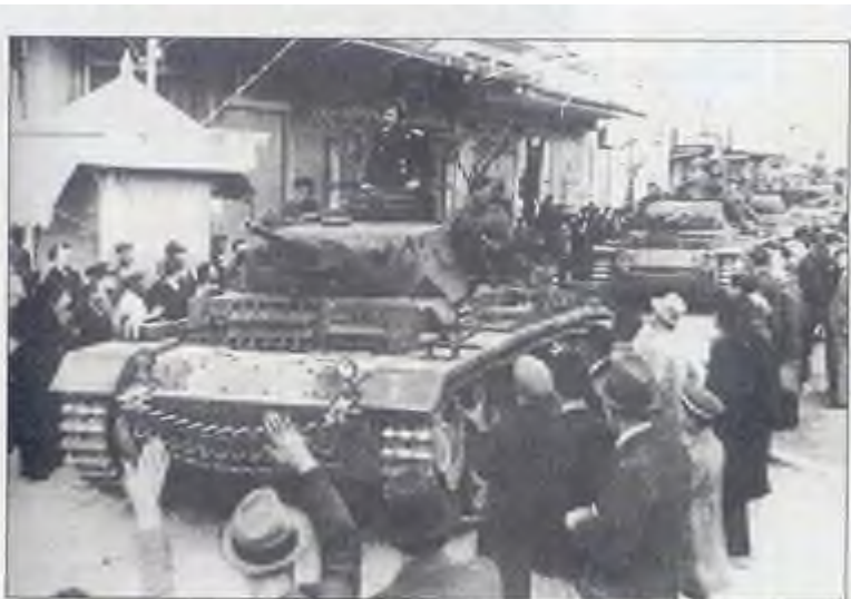
Οι Γερμανοί στη Θεσσαλονίκη. Προσέξτε τον "φιλοχιτλερικό" χαιρετισμό ορισμένων "Ελλήνων" της συμπτειτεύουσας.