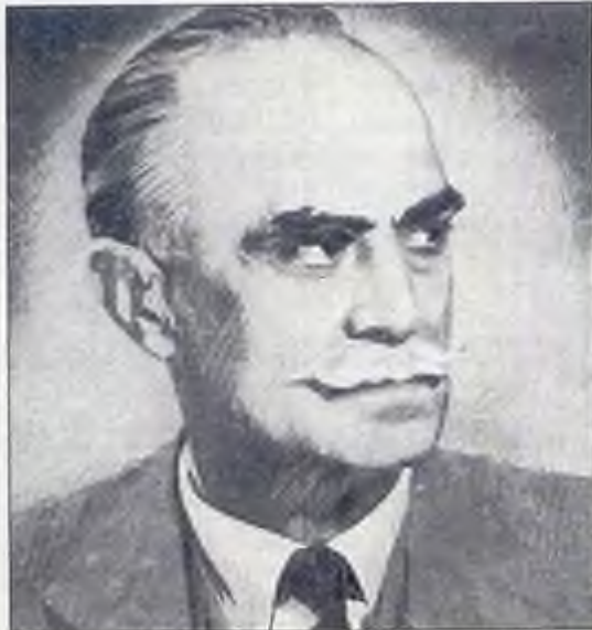
Ο στρατηγός Ν. Πλαστήρας.

Υ.Γ. Έλαβα και τα δεύτερα αντίτυπα της μεταφράσεως. Η μετάφραση είναι περίφημη, απέδωκες πληρέστατο πνεύμα, σε ευχαριστώ θερμότατα. Ο κ. Στεργιάδης μέχρι προχθές Σάββατον δεν έλαβε καμμίαν επιστολήν από την κ. Σάνου".