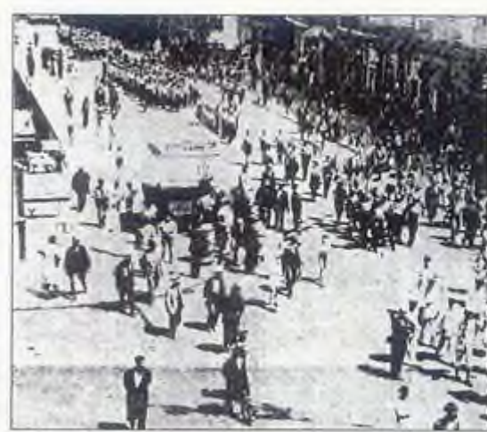
Σκηνή από την κάθοδο των Τριών Έψιλον στην Αθήνα τον Ιούνιο του 1933. Η φάλαγγα ανεβαίνει την οδό Σταδίου. φ3

Το Ανώτατον Διοικητικόν Συμβούλιον της ΕΕΕ".