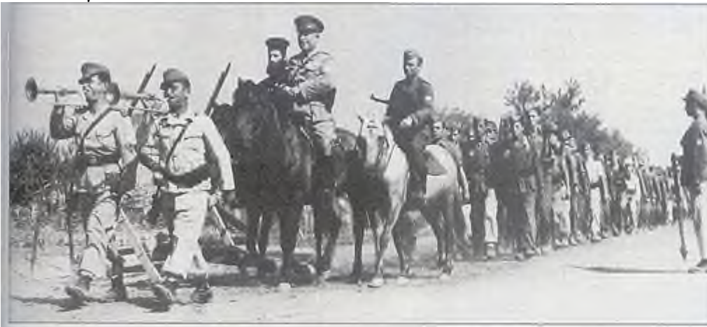
Το Σώμα του Πούλου εγκαταλείπει την Κρύα Βρύση (Ιούλιος 1944). Οι περισσότεροι άνδρες του φορούν γερμανικές στολές.

Τον Απρίλιο του 1944 ο ΕΛΑΣ αποφάσισε να δώσει ένα γερό κτύπημα στο "πουλικό απόσπασμα", ειδική ομάδα από 20 αντάρτες εισχώρησε στη Βέροια, όπου ήταν στρατοπεδευμένοι οι δοσίλογοι.