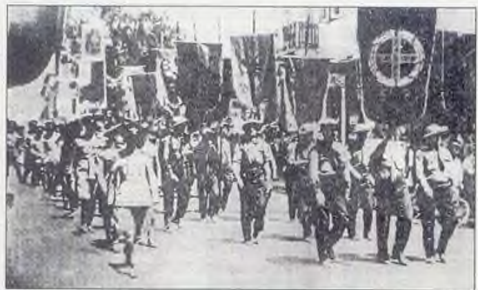
Παρέλαση Τριεψιλιτών με τα λάβαρα και τις σημαίες τους.

Μέσα στη συγκεκριμένη πολιτική κατάσταση της δεκαετίας του '30 οι "Τριεψιλίτες" επιχείρησαν, κατά το πρότυπο της πορείας του Μουσολίνι προς τη Ρώμη, να οργανώσουν μια