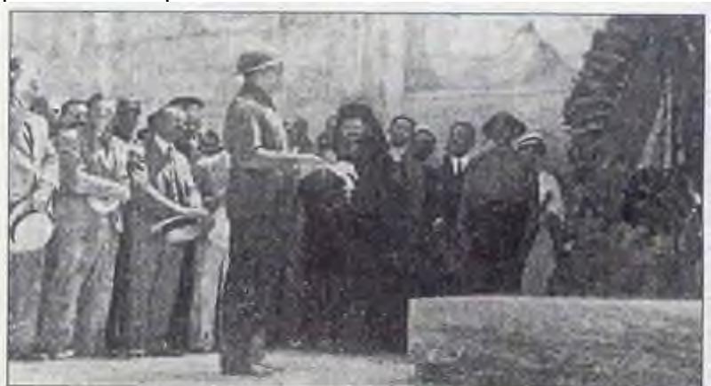
Τριεψιλίτης εκφωνεί λόγο μπροστά στο Μνημείο του Αγνώστου Στρατιώτη. φ4

σημαία τους. Επικεφαλής της πορείας ήταν οι ποδηλάτες Αλκιμοι με τις μπλε μπλούζες και η μουσική μπάντα του δήμου Αθηναίων. Ακολουθούσε η φάλαγγα των χαλυβδόκρανων με