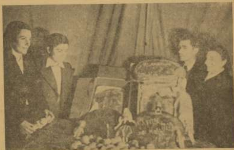
Οἱ Καλλιτέχνες Θεάτρου ἐτοιμάζουσι τὰ δῶρα τοὺς γὰρ τὰ θύματα

Ἡ ἐπιτυχία αὕτη πρέπει ν' ἀποδοθῇ στὴ συστηματικὴ καὶ οργανωμένη δουλειᾷ, καθὼς καὶ στὸ πλάτεμα τοῦ κύκλου τῶν ἀνθρώπων ποὺ βοηθοῦν στὸ ἔργο τῆς Ε. Α., μ' ἀποτέλεσμα, ἐκτὸς τῶν