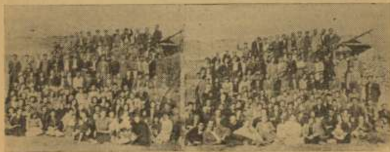
Οι εξόριστοι στο ξερονήσι του Άη-Στράτη

Έτσι το συμπέρασμα που βγαίνει είναι πως η δουλειά στους Έργατοπαλλήλους «μπήκε μπρός». Αναζωογονήθηκε η παλιά δύναμη, κερδίσαμε καινούργιους συνεργάτες και φίλους, έδραιώθηκε το κύρος του Σωματείου μας σ' αυτόν τον κόσμο.